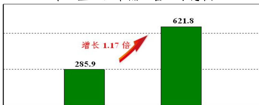
十二五“四个翻一番”示意图